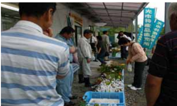
光市東荷特産品発売所で

野菜や魚は新鮮でお値段も安く、地元産という点 も評価できます。店員の方のサービスも良く、自由に 買い物が出来るところも気楽でよかったです。交流 館の商品は、本物の味と旬の物のおいしさが良く分 かります。