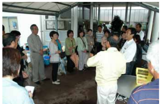
マネージャーから説明を受ける会員