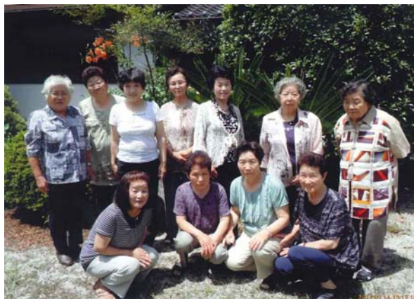
メンバーの皆さん