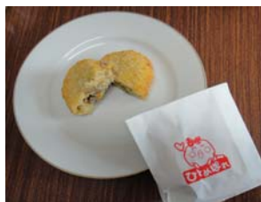
ごぼむすころっけ

1月27日、農商工業者が連携して新商品や新サービスの開発を目指す県中小企業団体中央会の「農商工連携等人材育成事業」報告会において、50社の中から、「惣菜工房ひとめぼれ♡」の「ごぼむすころっけ」と「湯のやき」の2品が揃って、最優秀賞に選出されました。