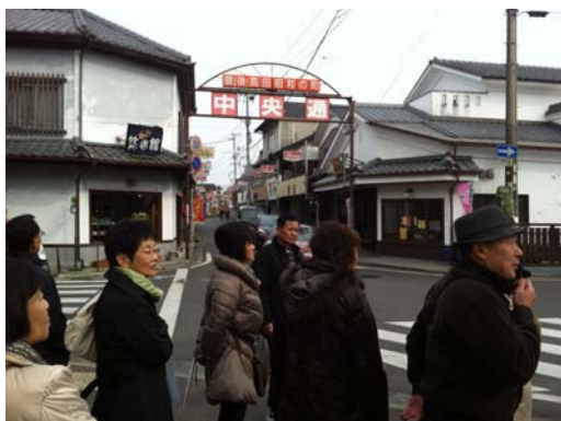
昭和の町案内人の説明を聞く皆さん

講話の後、昭和の町案内人さんによる昭和の町の見学を行いました。通りに沿って、その店が建てられた頃の昔なつかしい「昭和の建物」を再現し、その店の歴史を物語る「昭和のお宝」を展示し、またその店に代々伝わる「昭和の商品」を販売するなど、まさに昭和の時代にタイムスリップしたような雰囲気でした。