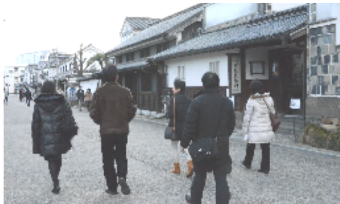
倉敷美観地区を自由に散策

楽しい研修旅行の中、みんなが色々な情報を得られたと思います。その情報を大好きな「まち」のために、少しでも役に立てることができるよう、「西徳山まちづくりの会」で今後も活動していきたいと心を新たにしたい機会となったと思います。(村林 記)