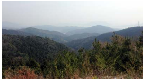
「神宮あさひの里」の大パノラマ

苔谷に一步踏み入ると、文字通りの錦秋に足とおしゃべりが止まります。カメラでパチリ、栗やどんぐりを拾い集めたり、道端の草花に話しかけたり、大忙しです。自然のお色直しをたっぷり味わいながら、健康組に遅れること1時間、昼直前に「全然疲れちよらんよ」とあさひの里に到着しました。