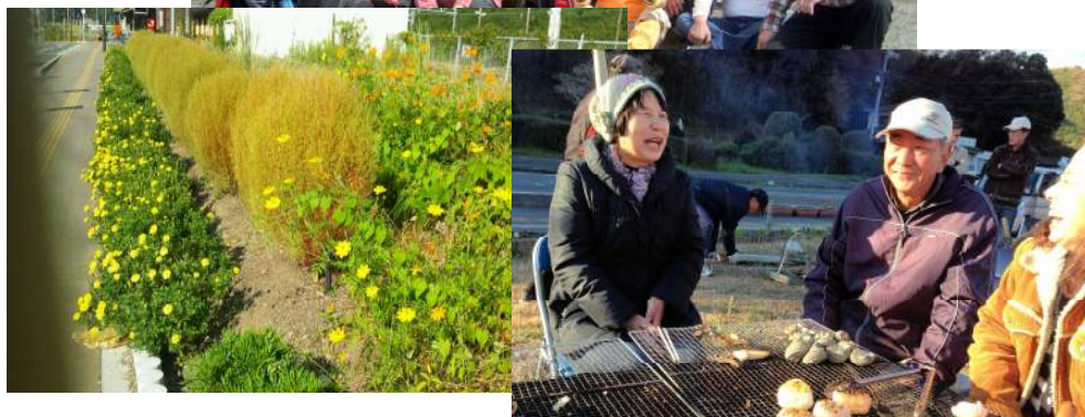
戸田駅前を飾るホーキ草