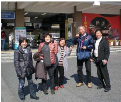
路上観察する皆さん！！はいポーズ

路上観察とは、1980年代、赤瀬川原平氏や藤森照信氏が提唱したもので、考現学の流れを汲みます。まちを歩き、路上のあらゆるところを徹底的に観察します。細部に目を凝らし、今そこにあるものの中から変わったもの、面白いものを見つけ、カメラに納めます。