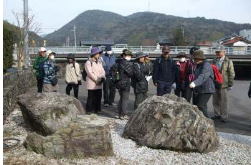
説明を熱心に聴く皆さん

マップ片手に JR 戸田駅を出発、まあ早いこと20分余りでソレーネ周南に到着。次に行くのはポンポン岩、この岩はなぜポンポン岩というのか不明である。参加者に主催者から宿題として託される。(宿題はできたのかな?)