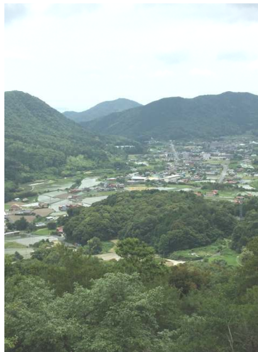
観音岳から湯野の里を望む

1990年（平成2年）6月より、国土地理院1/25,000の地図に、山名「観音岳」として正式に記載されています。